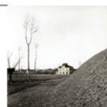
Castellina di Soragna