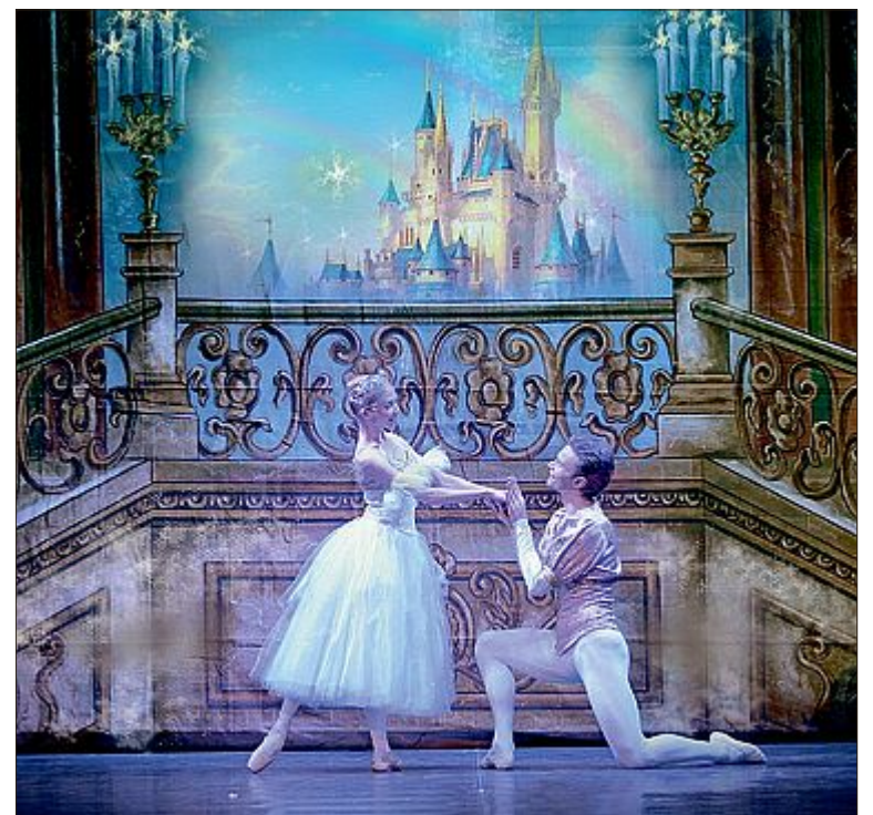
FASCINO Lo spettacolo teatrale "Cenerentola", in scena a Monza

KN VGCVTQ Creberg di Bergamo festeggia la Befana con "Il lago dei cigni" del Royal Ballet of Moscow - the Crown of Russia, corpo di ballo che annovera tra le sue fila ballerini di grande raffinatezza artistica provenienti dai migliori teatri russi. Appuntamento oggi alle 18. Domani alle 21, invece, il teatro Manzoni di Monza (Via Alessandro Manzoni 23) apre il sipario su "Cenerentola", interpretato dal Balletto di Mosca (musiche di Sergej Prokofiev e coreografie di Timur Gareev).