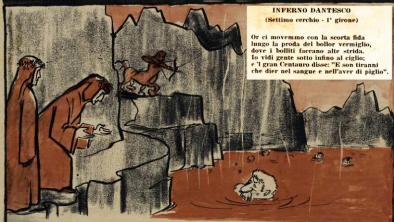
INFERNO DANTESCO (Settimo cerchio - 1° girone)

— Non ti lamentare per le scosse: è la strada che ti sei fatta tu.