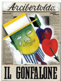
COPERTINA DELL'«ARCIBERTOLDO» 1937

da «Bertoldo» n. 102, 21 dicembre 1937, p. 2 Archivio Disegni Guareschi - Roncole Verdi (PR)