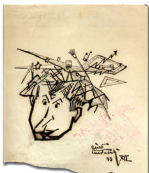
1932, PARMA. AUTOGARICATURA INEDITA DI UN GIOVANNINO "FUTURISTA"