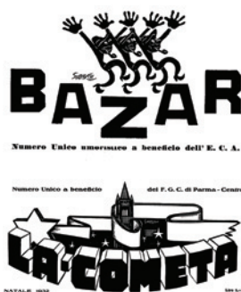
TESTATE DI NUMERI UNICI CREATE DA NOSTRO PADRE INCIDENDO IL LINOLEUM